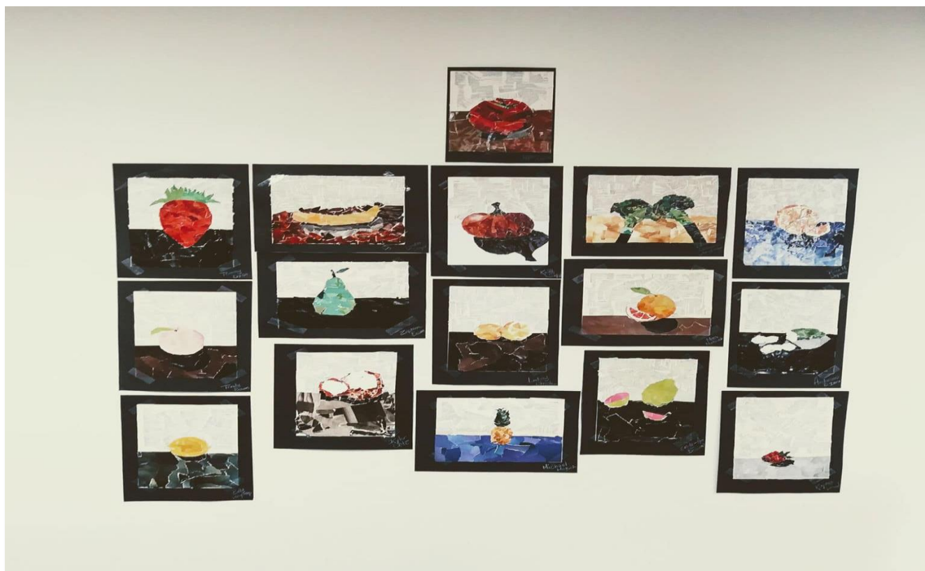
Cours d'arts plastiques, 2019-2020, 1 er niveau du secondaire École MacLean Memorial

Présenté aux parties prenantes et au ministre de l'Éducation