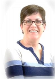
ESTHER PARADIS Circonscription 3 Ville de Québec (Centre & Ancienne-Lorette)